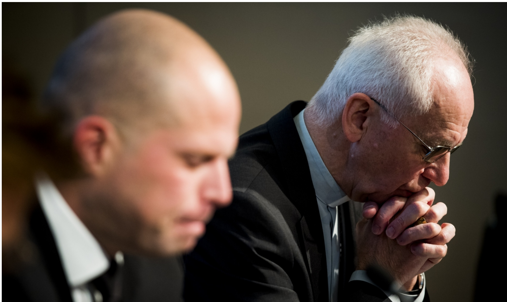
Staatssecretaris Francken met aartsbisschop Jozef De Kesel.